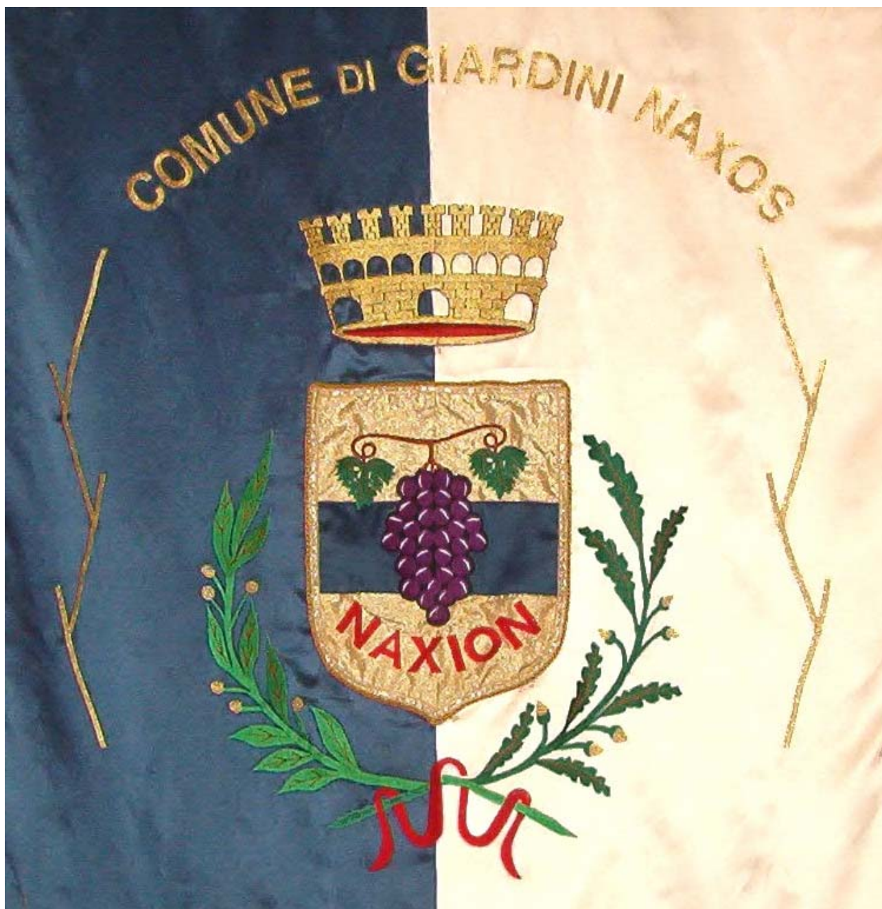
Gonfalone del Comune di Giardini Naxos